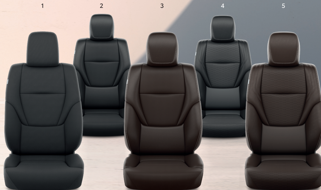
1. Crna tkanina Standard u paketu opreme ACTIVE